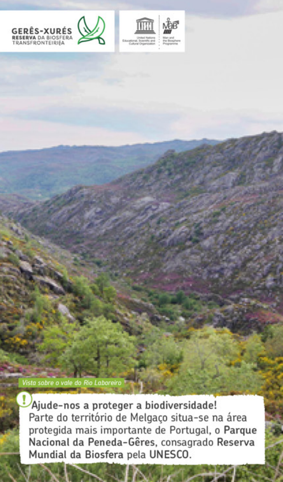
Vista sobre o vale do Rio Laboreiro

Ajude-nos a proteger a biodiversidade! Parte do território de Melgaço situa-se na área protegida mais importante de Portugal, o Parque Nacional da Peneda-Gêres, consagrado Reserva Mundial da Biosfera pela UNESCO.