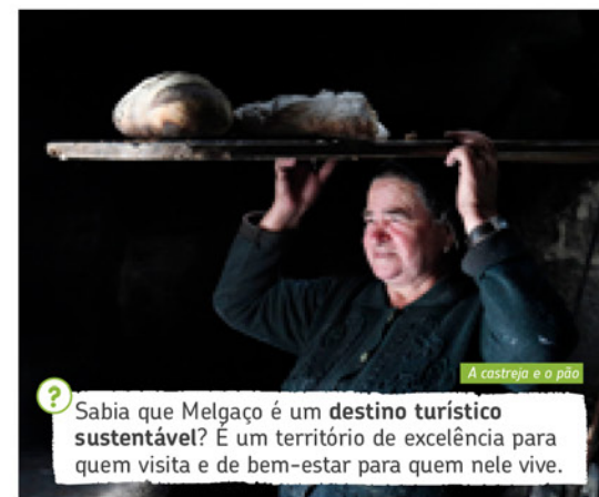
A castrejo e o pão

Sabia que Melgaço é um destino turístico sustentável? É um território de excelência para quem visita e de bem-estar para quem nele vive.