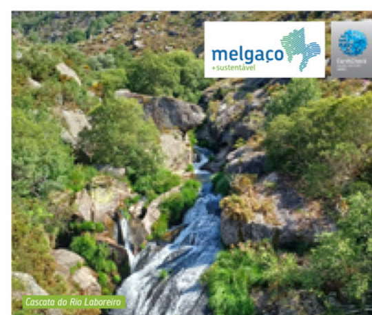
Cascata do Rio Laboreiro

Flora: Amieiro (Alnus glutinosa), Erva-loira-dos-bosques (Senecio nemorensis), Urze-branca (Erica arborea)